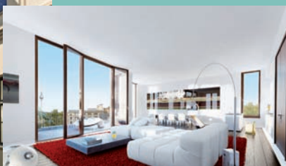
Außenansicht Innenansicht Referenzobjekt Zabel Immobilien KG Berlin-Mitte

Impressum: FIABCI Deutsche Delegation e. V. Brodstrangen 4 20457 Hamburg Tel.: +49 40 41 45 16 16 E-Mail: fiabci@fiabci.de Web: www.fiabci.de